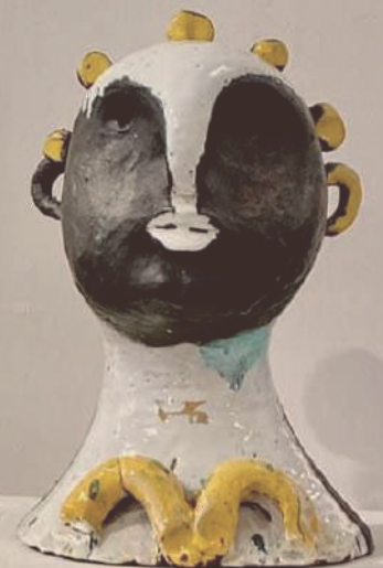
ANNONA E PIETRO CASCELLA TUTTA Ceramica policroma F. cm. 43 Anno 1950 ca. n. 127